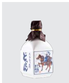
アラカルト壺 どっどん