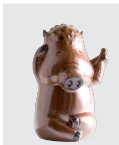
猪ちゃん壺 どっどん