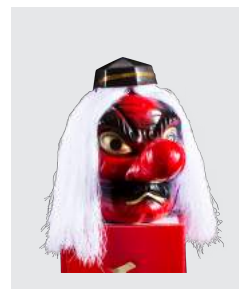
TENGU 壺 どっどん